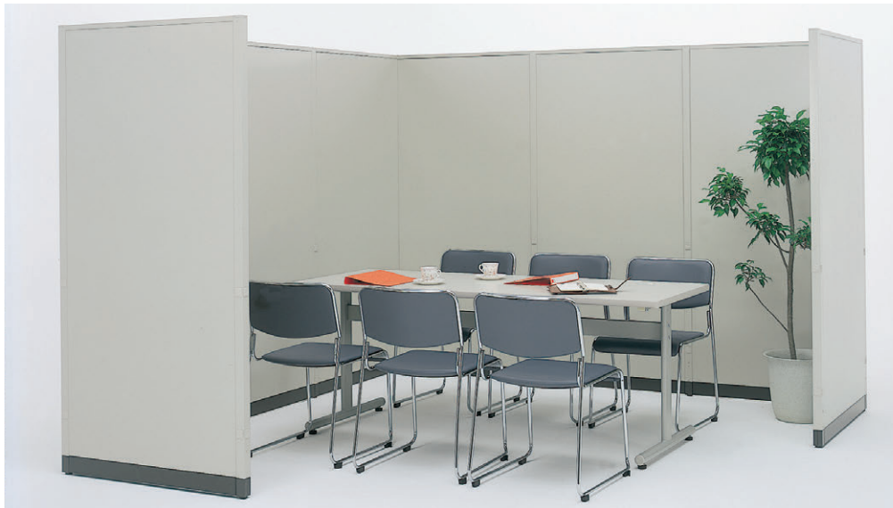
写真のパネルセット合計価格 ¥275,800 (LP3-P0918×8+LP3-6XEP×9)

パーツ構成が簡単なので、組立時間が短縮できます。オフィスでも工場内でもご使用いただけます。